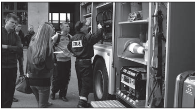
Kadeci w Jednostce Ratowniczo-Gaśniczej w PASŁĘKU

gowych (wypadków i karamboli), rozszczelnienia i wycieków tzw. technicznych środków przemysłowych (TŚP) typu chlor i amoniak, które są praktycznie zmagazynowane i użytkowane w każdym zakładzie przemysłu spożywczego np. w zakładzie mleczarskim w PASŁĘKU.