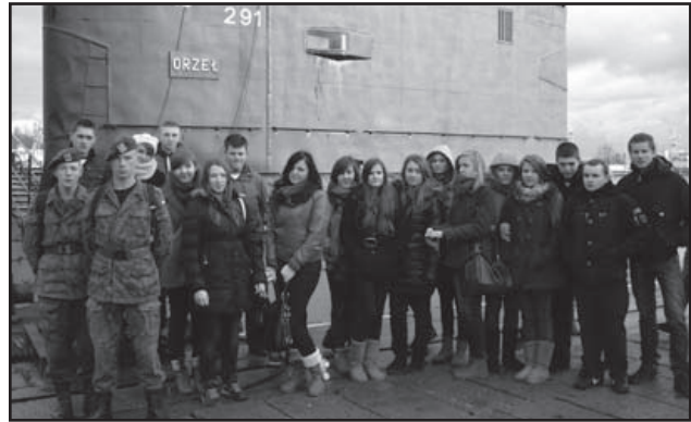
Nasze orły (właściwie orliki) przy ORP ORZEŁ

Po zwiedzeniu okrętu, (specjalnie wycięto dwa otwory dla tego celu) który był bardzo ciasny, pełen kabli, rur, pancernych drzwi, wąskich przejść i in-