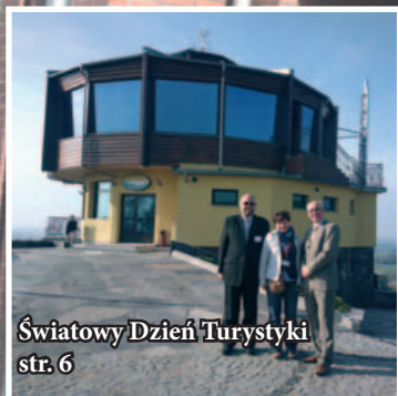
Światowy Dzień Turystyki str. 6