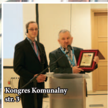
Kongres Komunalny str. 3