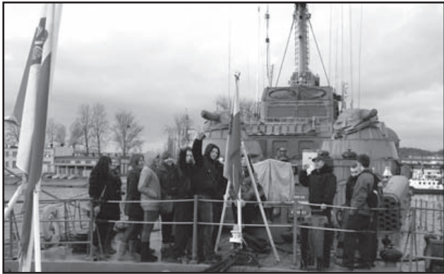
„Nasz” kuter torpedowy ORP ROLNIK