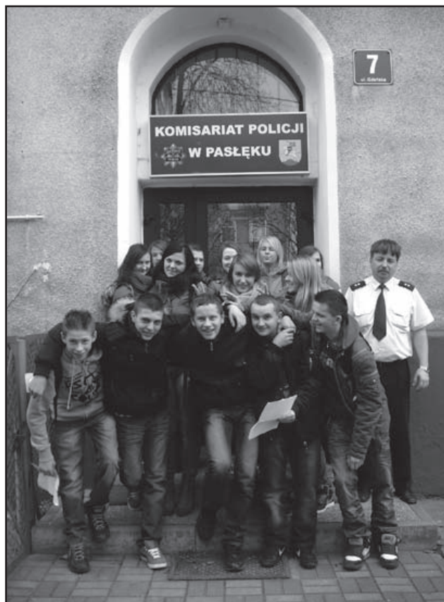
Kadeci przed komisariatem policji w PASŁĘKU

zaistnienia czynu karalnego np. palenia papierosów w szkole lub miejscu publicznym, spożywania alkoholu, używania słów wulgarnych, kradzieży w hipermarketach. Za każde wykroczenie czy przestępstwo grozi określona kara. Podobnie znieważanie (obrażanie) czy czynna napaść na nauczyciela jest czynem karalnym jak w stosunku do funkcjonariusza publicznego. Kadeci dowiedzieli się też, że w wypadku zauważenia jakiegoś przestępstwa, są zobowiązani udzielić pomocy ofiarom (w tym wypadków drogowych) oraz natychmiast powiadomić POLICJĘ.