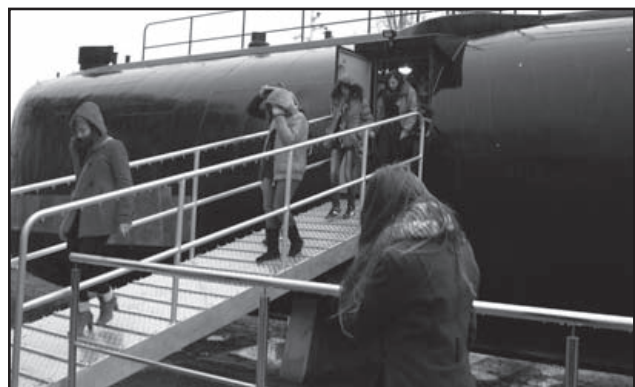
ORP JASTRZĄB (typu Kobben) na lądzie przed AMW GDYNI-OKSYWIU

Po zapoznaniu się ze służbą w PAŃSTWOWEJ STRAŻY POŻARNEJ, POLICJI oraz MARYNARCE WOJENNEJ kadeci I roku w maju, podczas pobytu na obozie szkoleniowym w 9 BRYGADZIE KAWALERII PANCERNEJ w BRANIEWIE, szczegółowo zapoznają się ze służbą w WOJSKACH LĄDOWYCH (obóz taki organizowany jest corocznie). W drugiej klasie poznają charakter służby w SIŁACH POWIETRZNYCH RP a w trzeciej w SŁUŻBIE CELNEJ I STRAŻY GRANICZNEJ. W najbliższym czasie także (trwają uzgodnienia) kadeci poznają warunki pracy w SŁUŻBIE WIĘZIENNEJ (areszt w ELBLĄGU). Reasumując, uczeń (kadet) w ciągu trzyletniego okresu nauki (szkolenia) ma możliwości poznania warunków i charakteru praktycznie każdej służby mundurowej, w tym szczegółowo służby w WOJSKACH LĄDOWYCH z uwagi na porozumienie zawarte przez naszą szkołę z Jednostką Wojskową w BRANIEWIE. Ma więc pełną możliwość świadomego wyboru rodzaju służby (formacji), czego życzyć wszystkim naszym kadetom.