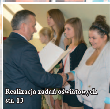
Realizacja zadań oświatowych str. 13