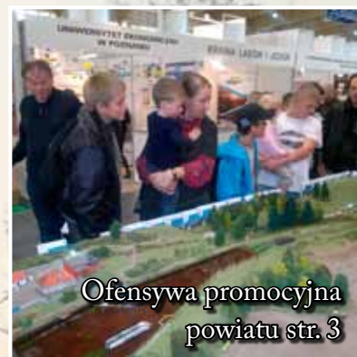
Ofensywa promocyjna powiatu str. 3