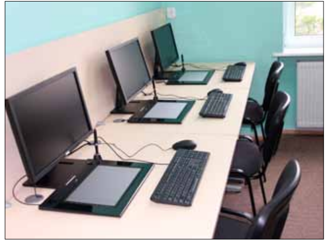
Nowa pracownia multimedialna Liceum Plastycznego w Gronowie Górnym

Zdawalność egzaminu potwierdzającego kwalifikacje zawodowe w zasadniczych szkołach zawodowych w powiecie elbląskim wynosiła 74,3% (w roku 2009/2010 wynosiła 95%).