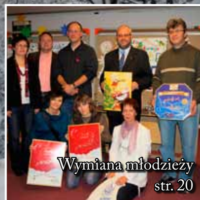
Wymiana młodzieży str. 20