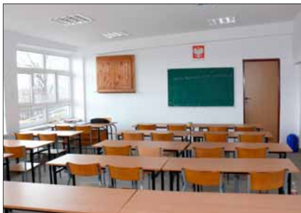
Jedna z nowo powstałych sal lekcyjnych w warsztatach ZSEiT w Pasłęku

Dla szkół ponadgimnazjalnych kończących się maturą najistotniejsze są wyniki egzaminu maturalnego oraz wyniki egzaminów zawodowych.