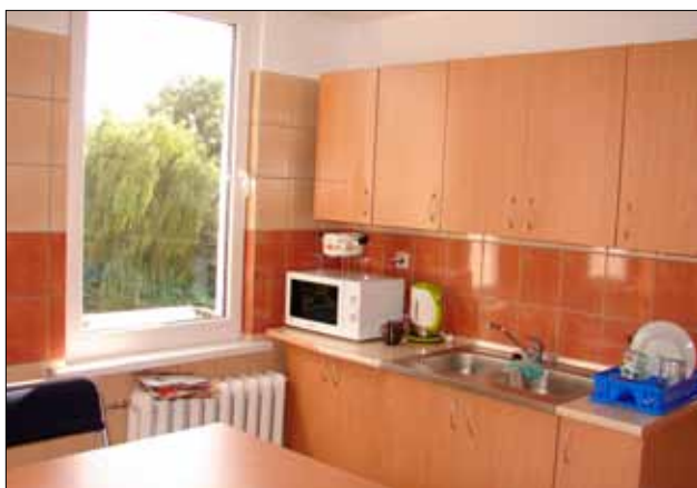
Kuchnia w nowo powstałym schronisku młodzieżowym w ZSEiT w Pasłęku

Poziom wykorzystania środków wyniósł 43 602 zł i był o 10 275 zł większy niż w roku 2009/2010. W ramach tych środków 12 080 zł zostało przeznaczonych na dofinansowanie studiów wyższych i studiów podyplomowych nauczycieli, na dofinansowanie kursów i szkoleń nauczycieli oraz dyrektorów 17 015 zł, a na szkolenia rad pedagogicznych 12 687 zł. Łącznie na różnego rodzaju szkolenia nauczycieli i dyrektorów placówek wydano 10 376 zł więcej niż w roku 2009.