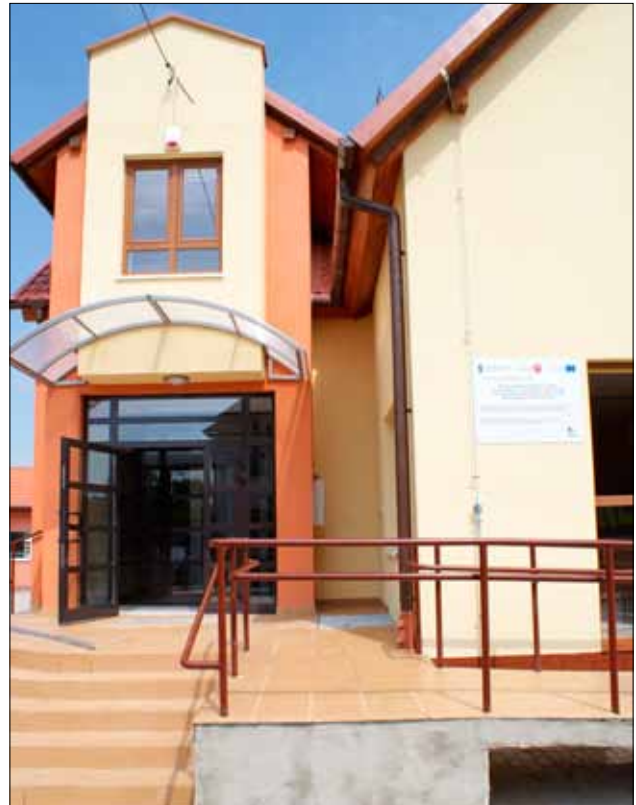
Budynek technikum hotelarskiego w Zespole Szkół w Pasłęku

Największą grupę zatrudnionych stanowili nauczyciele dyplomowani 44,6% (41,2% w roku 2009/10), a najmniejszą nauczyciele stażyści 5,2% (4,6% w roku 2009/10). W ogólnej liczbie zatrudnionych, 138 (136 w roku 2009/2010)