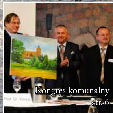
Kongres komunalny str. 6