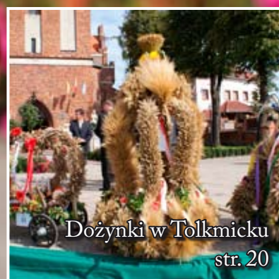
Dożynki w Tolkmicku str. 20