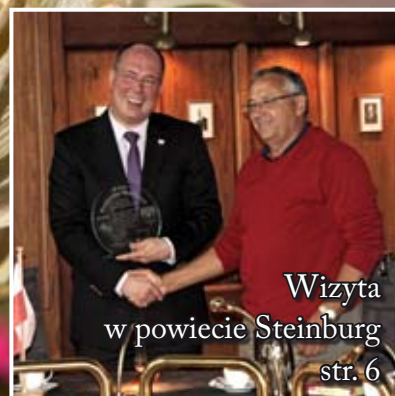
Wizyta w powiecie Steinburg str. 6