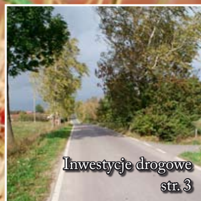
Inwestycje drogowe str. 3