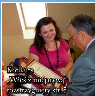
Konkurs „Wieś z inicjatywą” rozstrzygnięty str. 5