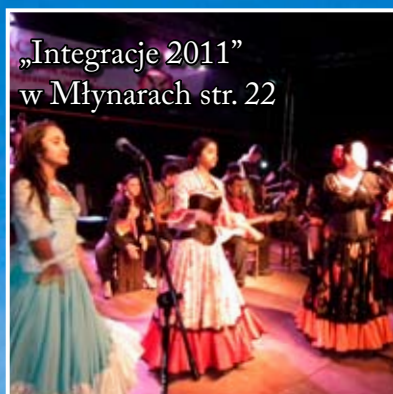
„Integracje 2011” w Młynarach str. 22