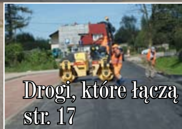
Drogi, które łączą str. 17