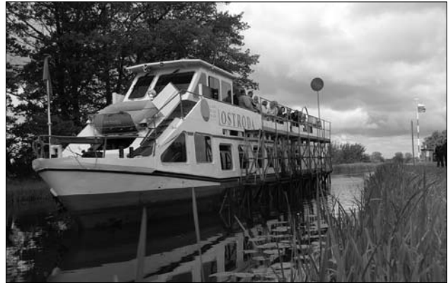
Rejs statkiem po Kanale Elbląskim

pętlę trasa przebiega przez sam środek nadmorskiej krainy i łączy wytwórnie sera pomiędzy Morzem Północnym a Morzem Bałtyckim, Łabą i granicą duńską. Liczne gospodarstwa serowarskie oraz ponad 30 zakładów produkcyjnych wytwarzają łącznie ponad 100 gatunków sera. Typowy dla regionu jest ser tyłżycki. Mimo postępu technicznego serowarstwo pozostało rzemiosłem, w którym ogromną rolę odgrywa kunszt i zaangażowanie mistrza.