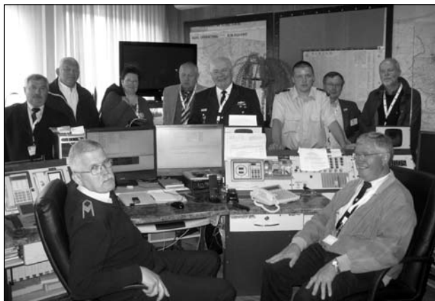
Placówka straży pożarnej i posterunek systemu ratowniczego powiatu Steinburg

Grupy uczestniczące w projekcie nabyły nowe umiejętności z zakresu dotychczas realizowanych zadań o wiedzę i doświadczenie partnera zagranicznego. Nawiązane kontakty pozwolą na możliwość przygotowywania kolejnych projektów realizowanych wspólnie przez oba powiaty, szczególnie z zakresu oświaty, turystyki i promocji, bezpieczeństwa publicznego, pomocy społecznej i zdrowia ze środków z funduszy Unii Europejskiej i programów grantowych. Bezpośrednie kontakty pomiędzy przedstawicielami komisji Rad Powiatu, Wydziałami Starostw podczas wspólnej pracy na warsztatach zbliżyły do siebie oba narody i wzbogaciły o doświadczenia. Mamy nadzieję, że projekt będzie mógł być kontynuowany w następnych latach przy wykorzystaniu wsparcia finansowego z zewnątrz.