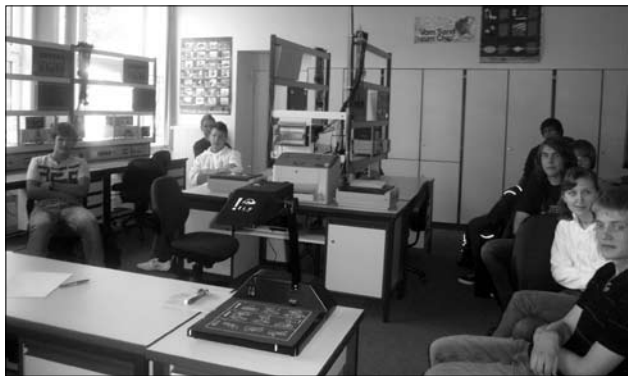
Regionalne Centrum Szkolenia Zawodowego w Itzehoe