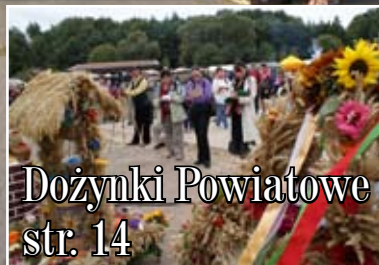
Dożynki Powiatowe str. 14