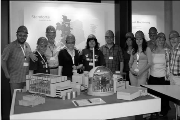
Wizyta w elektrowni jądrowej Brokdorf, która również funkcjonuje jako atrakcja turystyczna regionu

ną. Opiekują się nimi członkowie stowarzyszeń powoływanych specjalnie w tym celu. Uwagę zwraca fakt, że organizacje te w większości opierają swoje działania na funduszach pochodzących ze składek członkowskich i nie korzystają ze wsparcia finansowego państwa czy samorządu. Kolejna wizytacja odbyła się w muzeum fajansu w Kellinghusen. Miejscowość skutecznie powiązała swój wizerunek z tematyką fajansu, m.in. poprzez umieszczenie dużych ceramicznych obiektów na rondach przy drogach dojazdowych do miasteczka. W centrum widać również wiele akcentów związanych z produkcją fajansu. Wszystkie te cechy sprawiają, iż miejscowość zyskuje na atrakcyjności turystycznej i może skutecznie wykorzystywać tematykę fajansu jako element promocji.