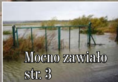
Mocno zawiąło str. 3