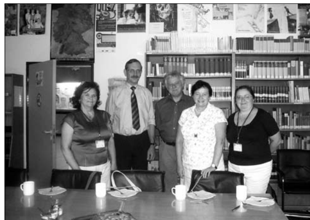
„Grupa oświatowa”. Gimnazjum w Itzehoe

w Niemczech, w których klimat wydaje się bardziej „surowy i zimny”. Natomiast strona polska była pełna uznania dla dobrze zorganizowanego kształcenia zawodowego w Niemczech oraz bardzo dobrej bazy do praktycznego kształcenia zawodowego. Podobno się również finansowanie płac dla nauczycieli