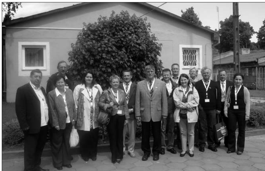
„Grupa oświatowa” w Młodzieżowym Ośrodku Wychowawczym w Kamionku Wielkim

Wizyta w Polsce grupy OŚWIATA rozpoczęła się od Młodzieżowego Ośrodka Wychowawczego w Kamionku Wielkim. Goście byli zainteresowani zasadami finansowania tego typu placówek oraz prowadzonymi metodami pracy z trudną młodzieżą. Wyrażali słowa uznania za dobre wyposażenie klasopracowni i prowadzonymi metodami wychowawczymi w tym prowadzonymi w godzinach